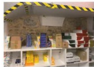
11 Interrato: muro medicinale recuperato