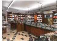
8 Mobili e vasi antichi di Farmacia