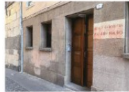
10 Lapide di via Cesare Battisti, 2