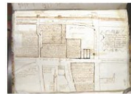
1 Le case dei Capodivacca e la chiesa di San Martin Immagine biblioteca Civica

Historie Patavine da spezieria da farmaco, basso medioevo, a Farmacia