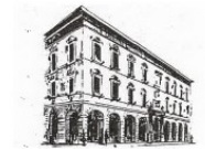
4 Il Bo ristrutturazione 1938-1943