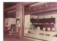
5 La vetrina in ostione con vetri bombati