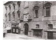
3 Il Bo fine '800