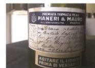
6 Preparazioni galeniche