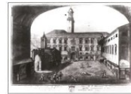
2 Il Bo nella Contrà di San Martin