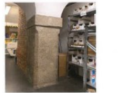
12 Interrato: pilastro medicinale